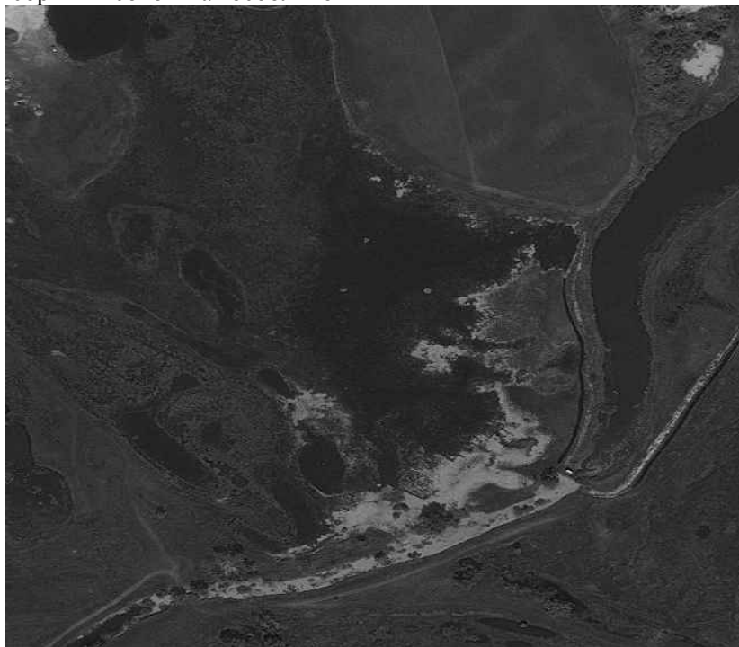
Рис.2. Нечіткі межі перезвожених ландшафтів прибережної території р. Дніпро поблизу м.Київ

надвисокої роздільної здатності. У табл. 1 наведено дані щодо можливих масштабів карт залежно від розміру піксела растрового зображення деяких сенсорів.