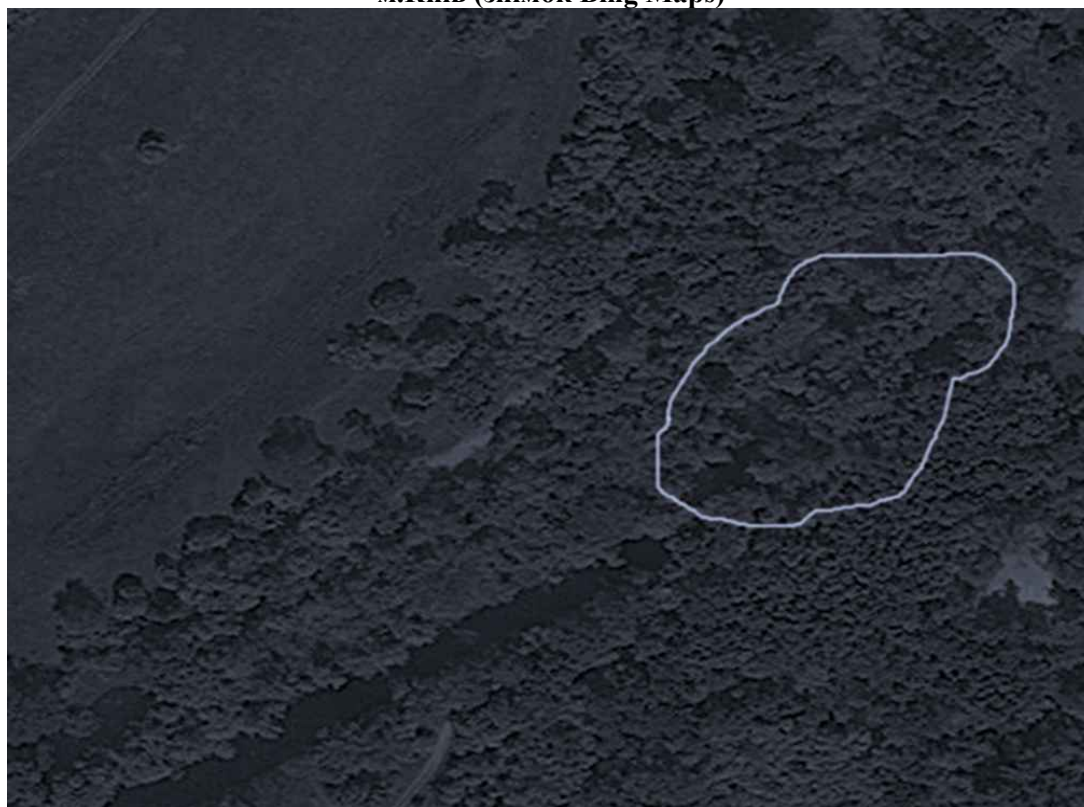
Рис. 3. Перекриття прибережної території кронами дерев та виділений контур їх змикання над невеликими водними об'єктами. Околиці м. Київ.