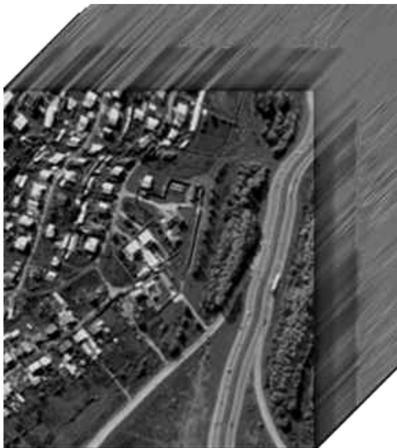
Рис. 4. Гіперспектральне зображення у формі "гіперкубу" [6].

Гіперспектральне знімання дозволяє розширити діапазон застосування даних дистанційного зондування за рахунок великої кількості (десятки, а іноді й сотні) спектральних каналів, кожен з яких несе в собі дані про територію у вузькій смузі випромінювання, а ці смуги у своїй сукупності являють майже неперервний спектр у певній (найчастіше у видимій та частині інфрачервоної) області спектру.